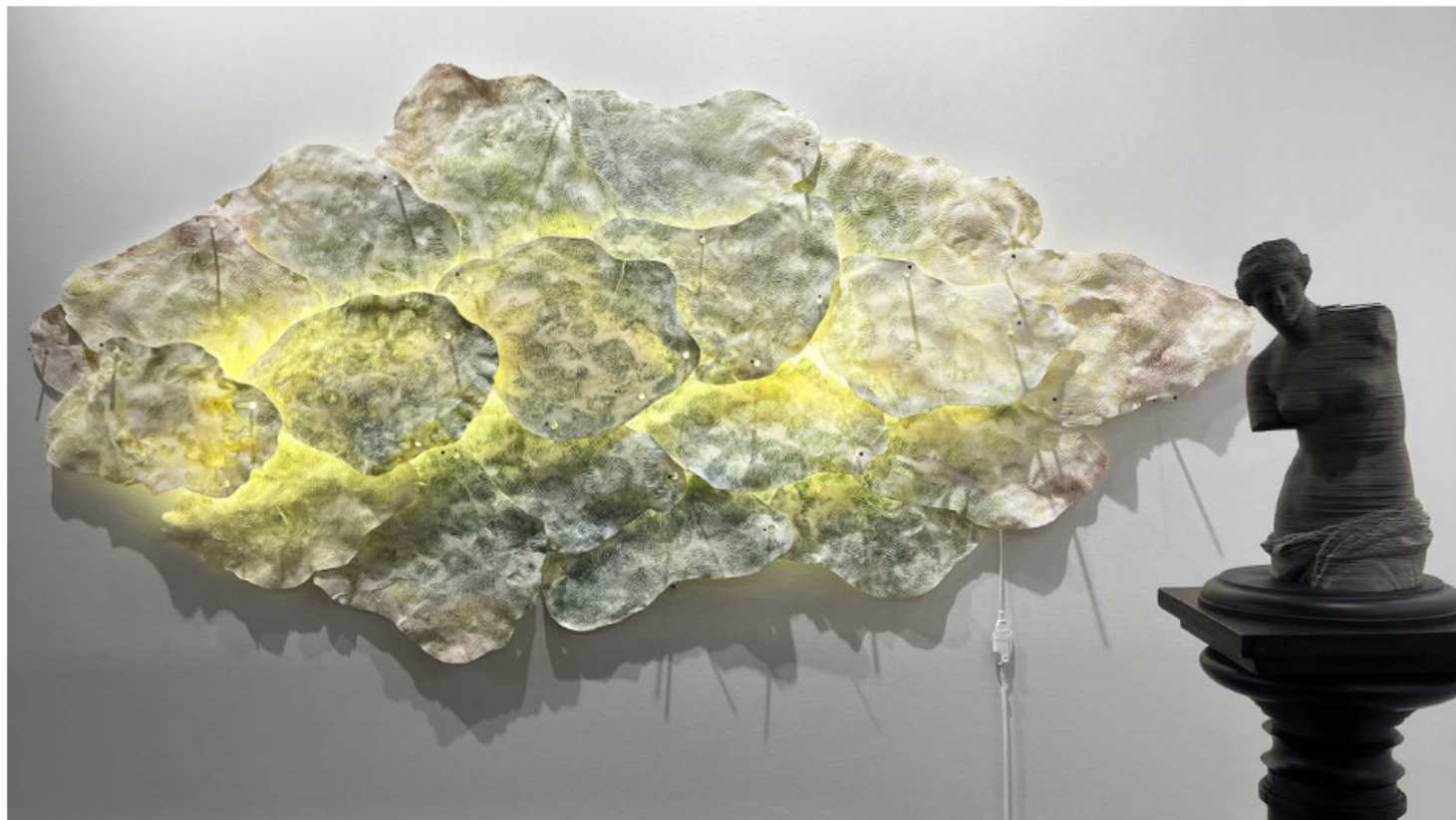
Éclaire d'Alice Bidault et Vénus de Milo, Transcription (1998) de Gérard Collin-Thiébaud sur le stand de la galerie Pietro Spartà

Pour sa 26 e édition, qui se tient du 4 au 7 avril au Grand Palais Éphémère, Art Paris joue les cartes de la qualité et du calme alors que le marché de l'art se tend et que les ventes s'amenuisent, si l'on en croit les échos des dernières foires comme Maastricht et Art Basel Hong Kong.